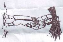
A LADY FARMER CARRYING PADDY ON HER HEAD