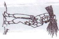
A LADY FARMER CARRYING PADDY ON HER HEAD